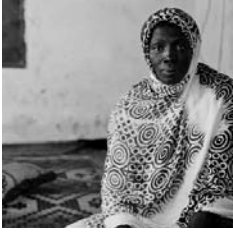
Femme Haratine, Nouakchott.